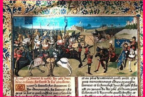
Seclin – Collégiale Saint Piat – Crypte. Tombeau du Saint

Pendant la première et la deuxième guerre mondiale, les villes subissent privations, occupations et bombardements.