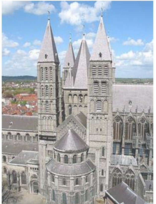
Cathédrale de Tournai

Des animations seront proposées tout le long du chemin et complétées par des parcours cycliste et de randonnée pédestre. Cette année, une excursion de découverte au départ de Seclin, permettra de découvrir le circuit entre balade et transport en bus dans le sens Tournai Seclin. Le point de départ se fera à l'avenir alternativement de Tournai ou de Seclin, villes positionnées à chaque extrémité du chemin.