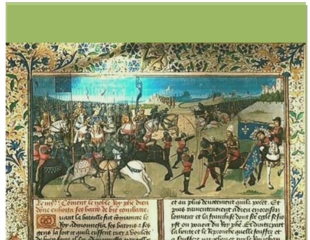
Seclin - Collégiale Saint-Piat – Crypte. Tombeau du saint

Pendant la première et la deuxième guerre mondiale, les villes subissent privations, occupation, bombardements.