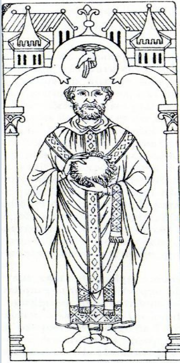
Saint Piat – Coll Seclin

Cette ancienne voie médiévale serait aussi une ancienne voie romaine. Son tracé reste visible sur des photographies aériennes.