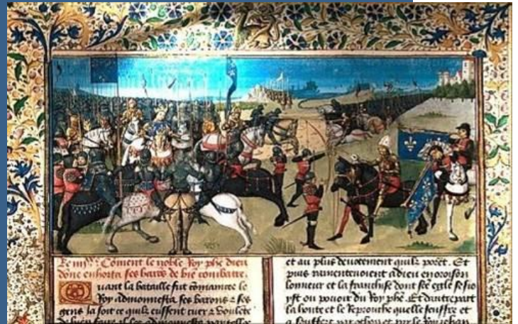
La Bataille de Bouvines

Pendant la première et la deuxième guerre mondiale, les villes subissent privations, occupation, bombardements.