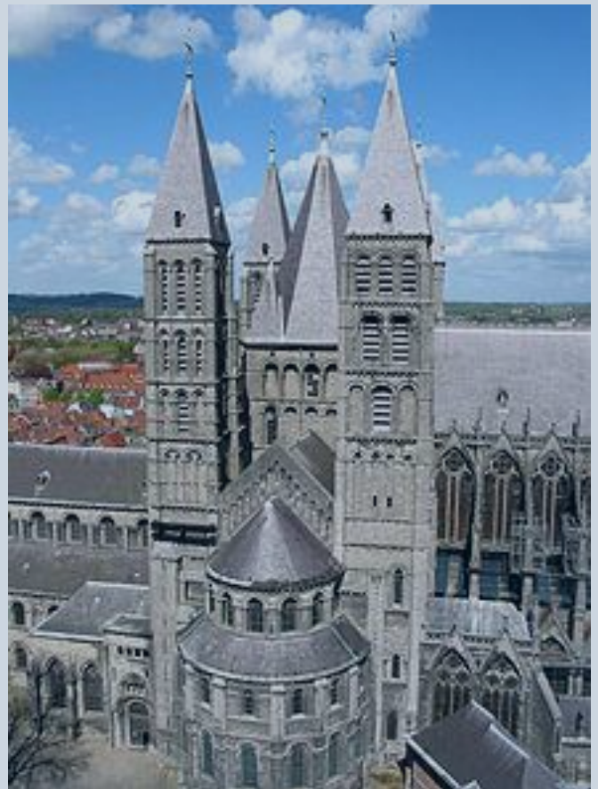
Cathédrale de Tournai

Grande manifestation transfrontalière annuelle sous forme de rallye culturel ouvert à tous et adapté aux familles. Une fois par an un événement sous forme de parcours sera proposé aux cyclistes, aux randonneurs et aux cavaliers. Le point de départ se ferait alternativement de Tournai ou de Seclin, villes positionnées à chaque extrémité du chemin.