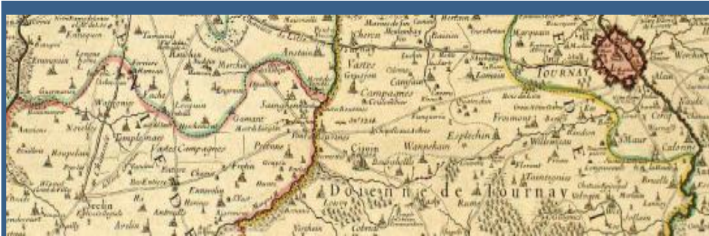
Une voie historique, un patrimoine multiséculaire, une promenade transfrontalière

Où ? Il existe un chemin transfrontalier quasiment rectiligne, en pleine zone rurale qui relie depuis des siècles la partie française et le secteur belge du vieux « Pays de Pévèle ». Ce chemin de 32 km réunit directement les communes de Tournai, Bouvines et Seclin 1/3 en Belgique et 2/3 en France.