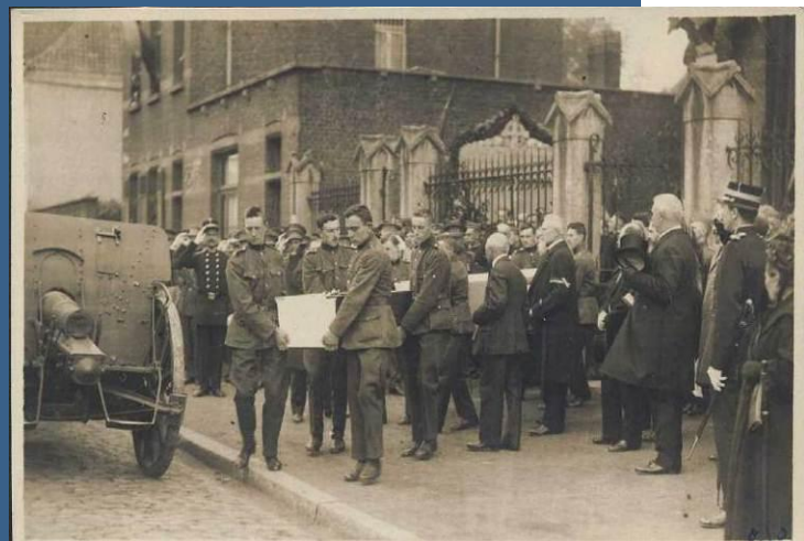
Tournai 1914 – Erection du monument des Vendéens